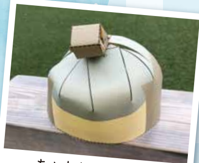
ちよんまげペーパー クラフトを作って撮影体験